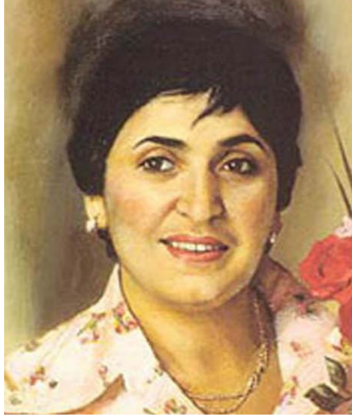
Zərifə Əziz qızı Əliyeva Azərbaycan SSR-nin əməkdar elm xadimi, tibb elmləri doktoru, Azərbaycan Milli Elmlər Akademiyaşın akademiki