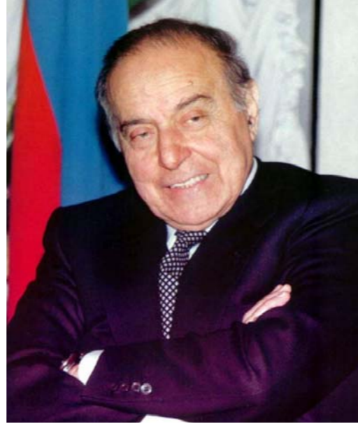
Heydər Əlirza oğlu Əliyev Azərbaycanın görkəmli siyasi və dövlət xadimi, Azərbaycan Respublikasının üçüncü Prezidenti "Ulu öndər" və "Azərbaycan xalqının ümummilli lideri" titullarının rəsmi daşıyıcısı.

Mənalı ömür yaşamaq hər insanın taleyinə yazılır. Elə insanlar var ki, onların ömür yolu gələcək nəsillərin həyatına işıq saçır, xalqa tükənməz bir xəzinə bəxş edir.