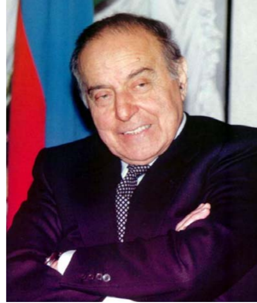
Heydər Əlirza oğlu Əliyev Azərbaycanın görkəmli siyasi və dövlət xadimi, Azərbaycan Respublikasının üçüncü Prezidenti "Ulu öndər" və "Azərbaycan xalqının ümummilli lideri" titullarının rəsmi daşıyıcısı.

Dövlət başçısı Bakı Dövlət Universitetinin 90 illik yubileyi ilə bağlı keçirilən təntənəli mərasimdəki çıxışında bununla bağlı demişdir: "Azərbaycan iqtisadi cəhətdən artıq oturmuş dövlət kimi tanınır. Mən hesab edirəm ki, biz artıq iqtisadi sahədə keçid dövrünü başa vurmuşuq. Nəzərə alsaq ki, dünyanın aparıcı maliyyə qurumları Azərbaycanda aparılan islahatları çox yüksək qiymətləndirir. Müxtəlif hesablamalara görə, Azərbaycan postsovet məkanında iqtisadi islahatlar və iqtisadi inkişaf baxımından birinci yerdədir. Mən hesab edirəm ki, artıq bu sahədə keçid dövrü başa çatıbdir.