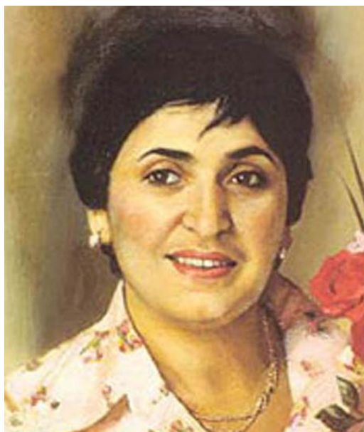
Zərifə Əziz qızı Əliyeva Azərbaycan SSR-nin əməkdar elm xadimi, tibb elmləri doktoru, Azərbaycan Milli Elmlər Akademiyasının akademiki