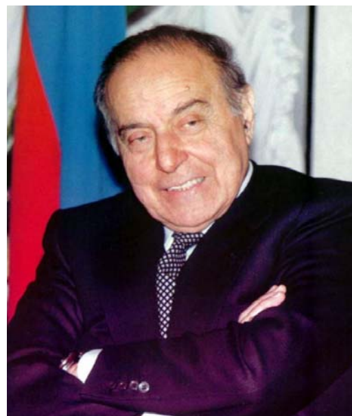
Heydər Əlirza oğlu Əliyev Azərbaycanın görkəmli siyasi və dövlət xadimi, Azərbaycan Respublikasının üçüncü Prezidenti "Ulu öndər" və "Azərbaycan xalqının ümummilli lideri" titullarının rəsmi daşıyıcısı.

Dövlət başçısı Bakı Dövlət Universitetinin 90 illik yubileyi ilə bağlı keçirilən təntənəli mərasimdəki çıxışında bununla bağlı demişdir: "Azərbaycan iqtisadi cəhətdən artıq oturmuş dövlət kimi tanınır. Mən hesab edirəm ki, biz artıq iqtisadi sahədə keçid dövrünü başa vurmuşuq. Nəzərə alsaq ki, dünyanın aparıcı maliyyə qurumları Azərbaycanda aparılan islahatları çox yüksək qiymətləndirir. Müxtəlif hesablamalara görə, Azərbaycan postsovet məkanında iqtisadi islahatlar və iqtisadi inkişaf baxımından birinci yerdədir. Mən hesab edirəm ki, artıq bu sahədə keçid dövrü başa çatıbdir.