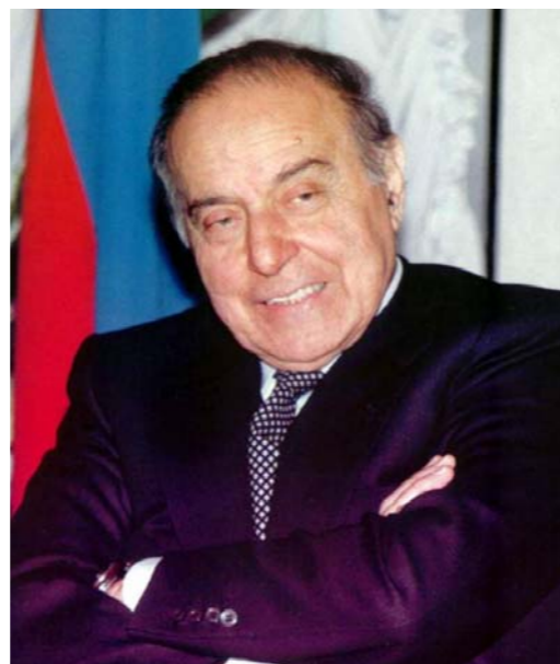
Heydər Əlirza oğlu Əliyev Azərbaycanın görkəmli siyasi və dövlət xadimi, Azərbaycan Respublikasının üçüncü Prezidenti "Ulu öndər" və "Azərbaycan xalqının ümummilli lideri" titullarının rəsmi daşıyıcısı.

Dövlət başçısı Bakı Dövlət Universitetinin 90 illik yubileyi ilə bağlı keçirilən təntənəli mərasimdəki çıxışında bununla bağlı demişdir: "Azərbaycan iqtisadi cəhətdən artıq oturmuş dövlət kimi tanınır. Mən hesab edirəm ki, biz artıq iqtisadi sahədə keçid dövrünü başa vurmuşuq. Nəzərə alsaq ki, dünyanın aparıcı maliyyə qurumları Azərbaycanda aparılan islahatları çox yüksək qiymətləndirir. Müxtəlif hesablamalara görə, Azərbaycan postsovet məkanında iqtisadi islahatlar və iqtisadi inkişaf baxımından birinci yerdədir. Mən hesab edirəm ki, artıq bu sahədə keçid dövrü başa çatıbdir.