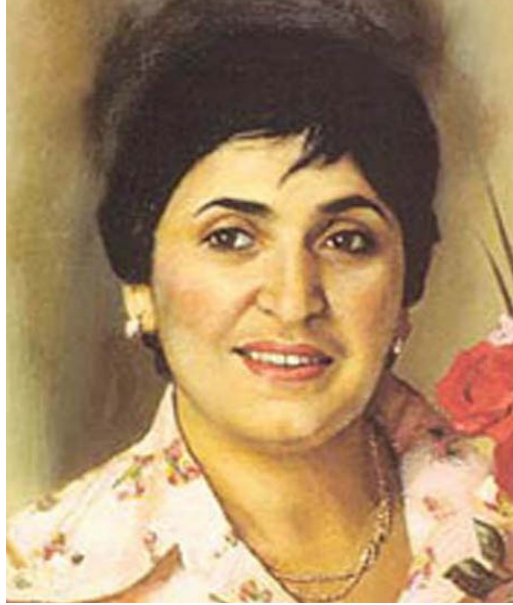
Zərifə Əziz qızı Əliyeva Azərbaycan SSR-nin əməkdar elm xadimi, tibb elmləri doktoru, Azərbaycan Milli Elmlər Akademiyasının akademiki