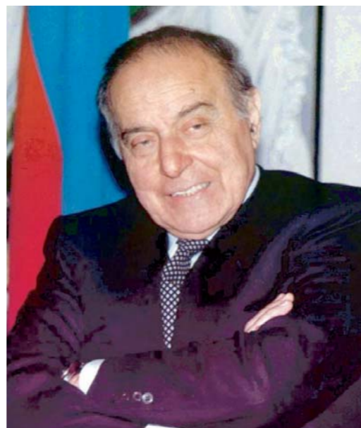
Heydər Əlirza oğlu Əliyev Azərbaycanın görkəmli siyasi və dövlət xadimi, Azərbaycan Respublikasının üçüncü Prezidenti "Ulu öndər" və "Azərbaycan xalqının ümummilli lideri" titullarının rəsmi daşıyıcısı.

Mənalı ömür yaşamaq hər insanın taleyinə yazılır. Elə insanlar var ki, onların ömür yolu gələcək nəsillərin həyatına işıq saçır, xalqa tükənməz bir xəzinə bəxş edir.